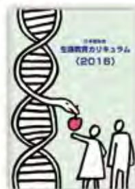
生涯教育カリキュラム(2016)