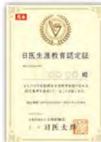
日医生涯教育認定証